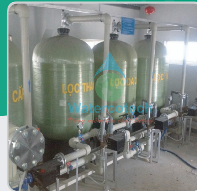
■ Công trình: Tại Zannier Hotels Bai San Ho Hạng mục: Thay vật liệu lọc