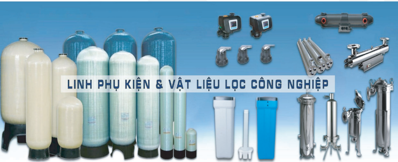
LINH PHỤ KIỆN & VẬT LIỆU LỌC CÔNG NGHIỆP