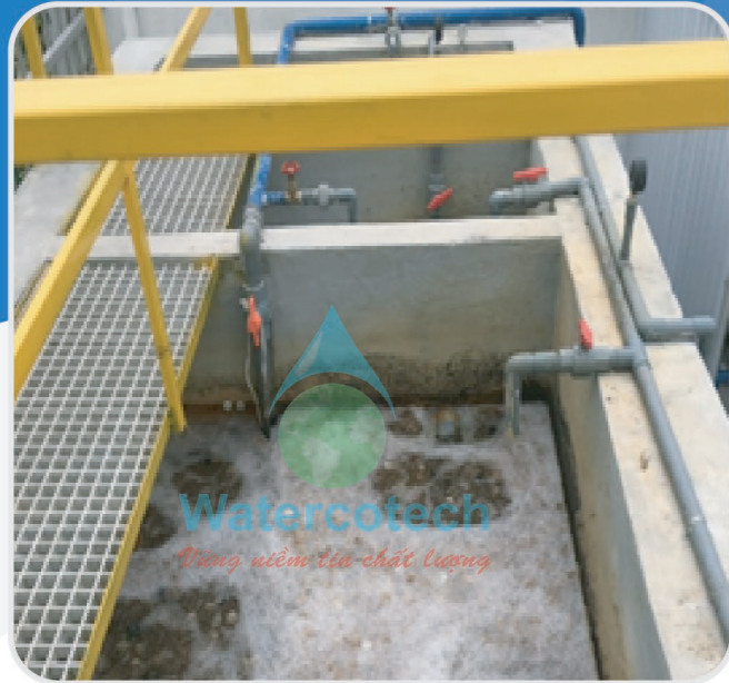
■ Công trình: Tại KCN Đà Nẵng Hạng Mục: Hệ thống xử lý nước thải sinh hoạt công suất 50m 3 / ngày đêm