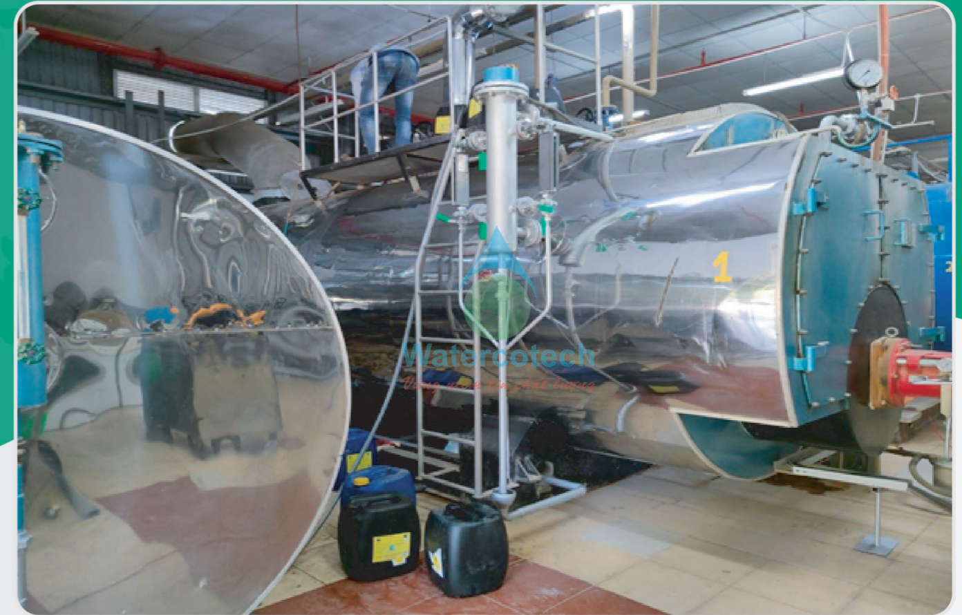
■ Công trình: Bảo trì 3 lò hơi tại Vinpearl (Đảo Hòn Tre - Nha Trang- Khánh Hòa )