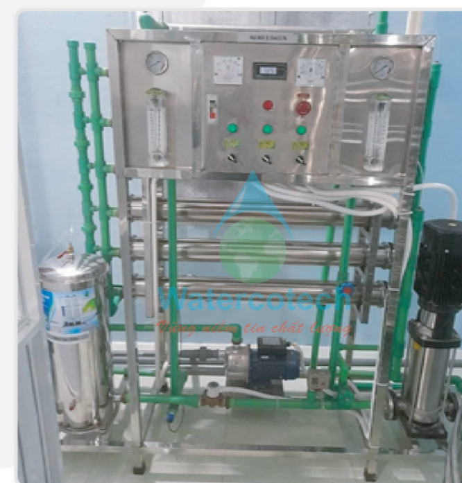
■ Công trình: Hệ thống RO 1.5m 3 /h nước đóng bình tại Quảng Ngãi