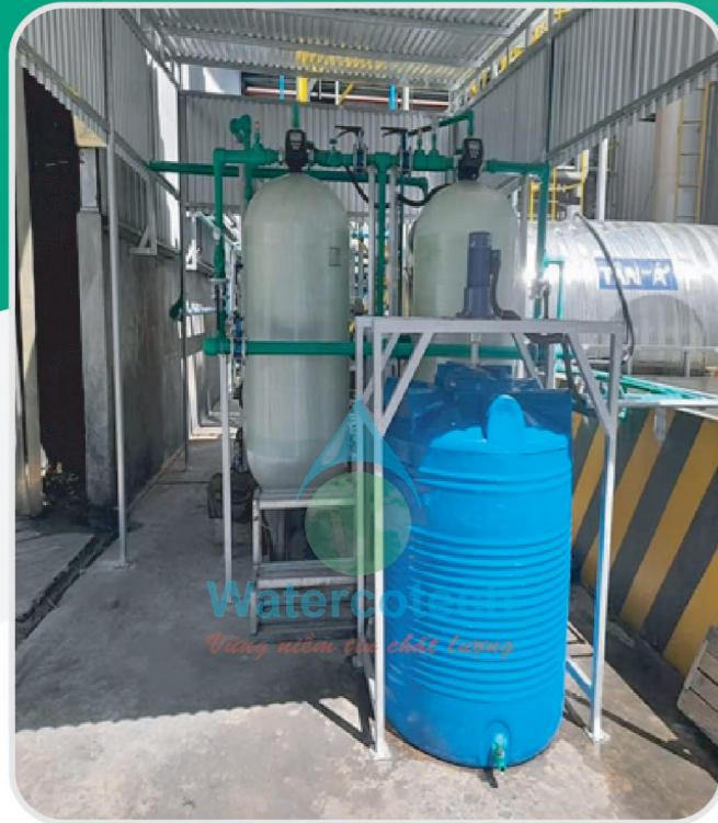
■ Công trình: Hệ thống làm mềm nước cho Boiler 13m 3 /h tại CP Bình Định