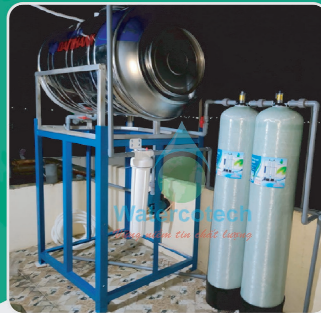
■ Công trình: Tại nhà dân Hạng mục: Dự án lắp đặt xử lý kim loại nặng