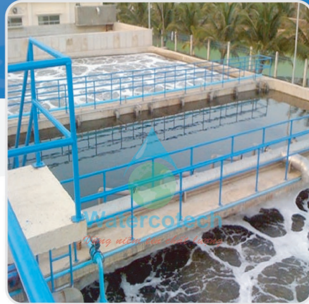
■ Công trình: Tại KCN Quảng Nam Hạng Mục: Hệ thống xử lý nước thải sinh hoạt công suất 150m 3 / ngày đêm