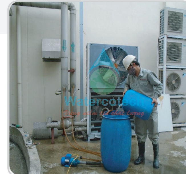
■ Công trình: Tại Lotte Nha Trang Hạng Mục: Tẩy rửa cầu cạn Chiller