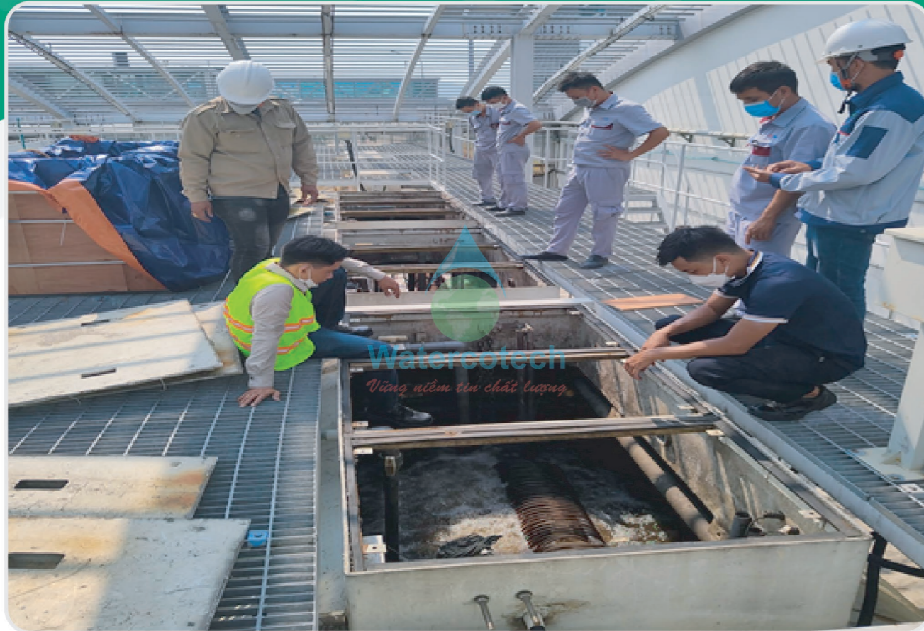
■ Công trình: Vệ sinh, bảo trì hệ thống xử lý nước thải 360m 3 ngày đêm tại Sân Bay Đà Nẵng