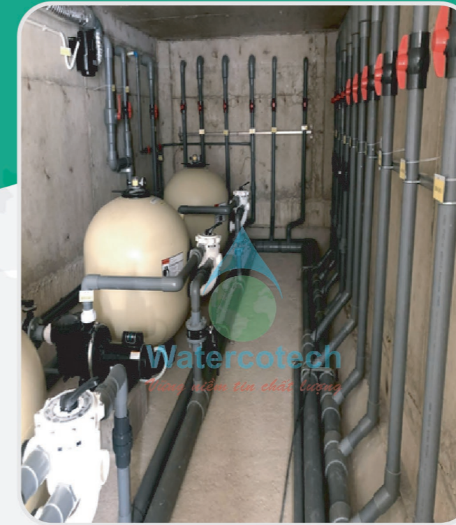
■ Công trình: Thi công hệ lọc hồ bơi tại Sungroup