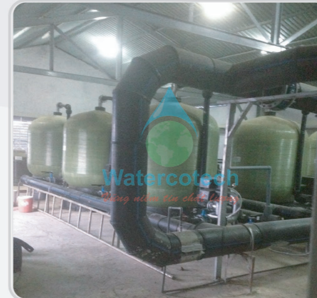
■ Công trình: Tại Vinpearl Nha Trang Hạng Mục: Cải tạo hệ thống nước cấp