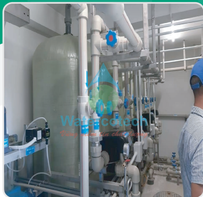
■ Công trình: Tại Resort Hòn Tằm Hạng Mục: Lắp đặt hệ thống lọc tổng sinh hoạt