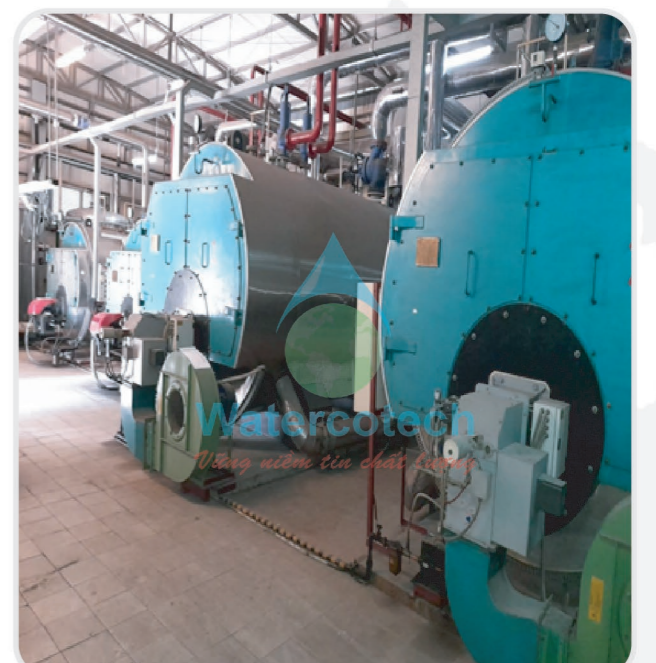
■ Công trình: Tẩy cặn lò hơi cho bệnh viện Quốc Tế Vinmec Hà Nội