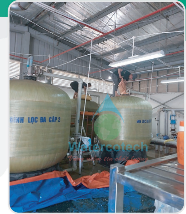
■ Công trình: Thay vật liệu lọc trạm nước cấp sinh hoạt tại Vingroup