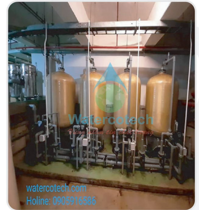
■ Công trình: Cải tạo trạm lọc nước cấp tại Shearaton Nha Trang