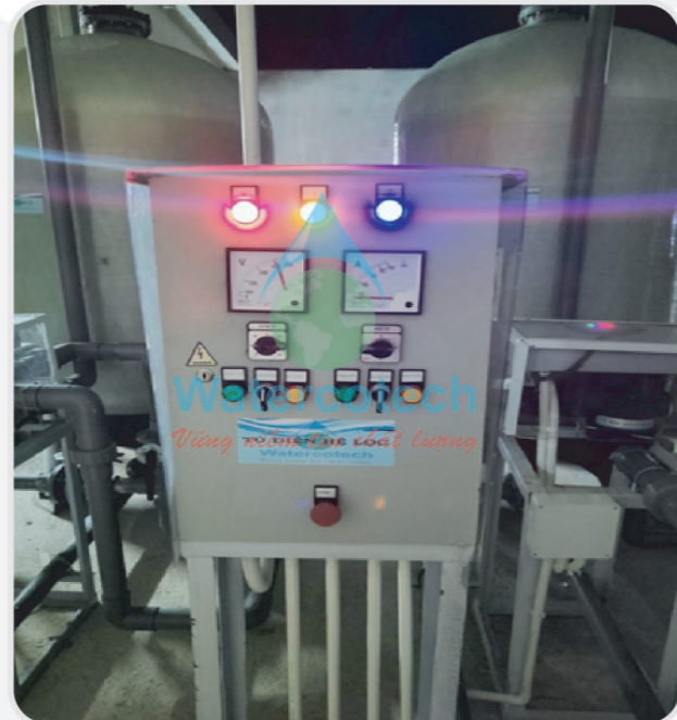
■ Công trình: Lắp đặt hệ lọc nước cấp - Nhà Máy Whitex - KCN Vsip