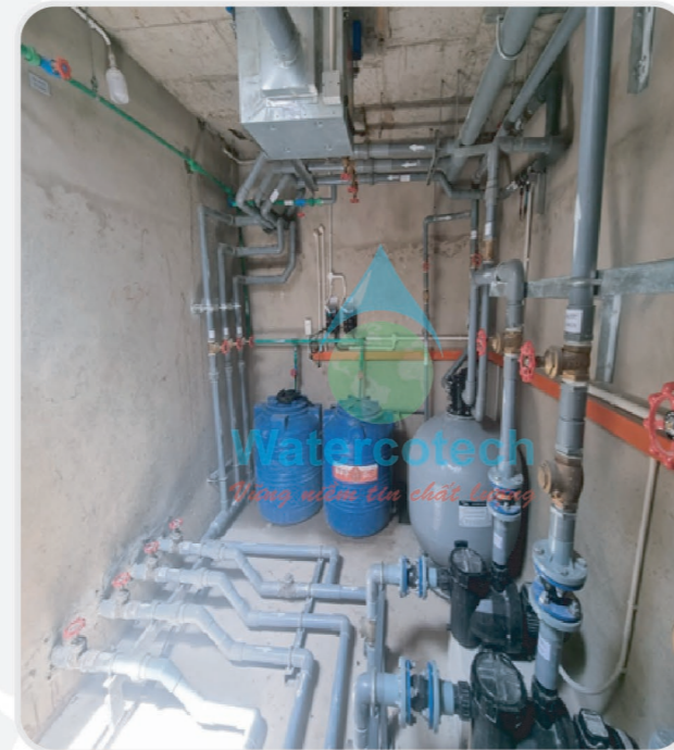
■ Công trình: Thi công hệ thống lọc hồ bơi tại Resort Phan Thiết - Bình Thuận