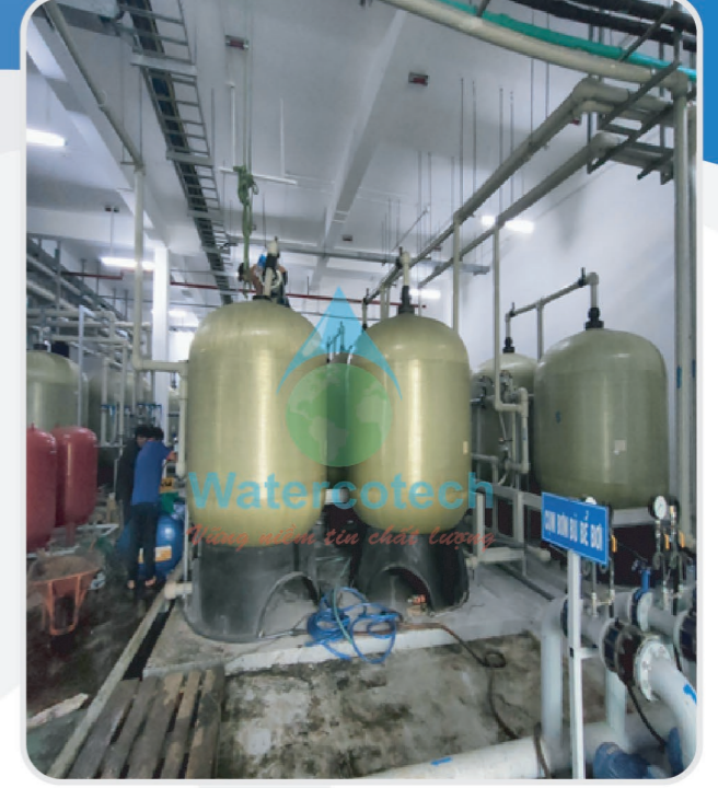
■ Công trình: Thay vật liệu và cải tạo trạm lọc nước cấp tại Resort Movenpick Phú Quốc