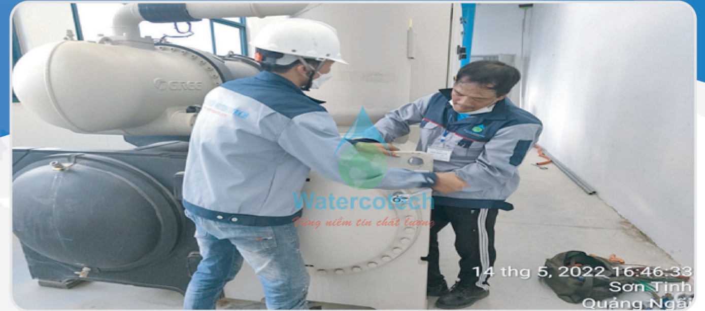
■ Công trình: Bảo trì hệ thống Chiller nước tại Happy Furniture - KCN Visip Quảng Ngãi Hạng mục: Bảo trì hệ thống Chiller nước