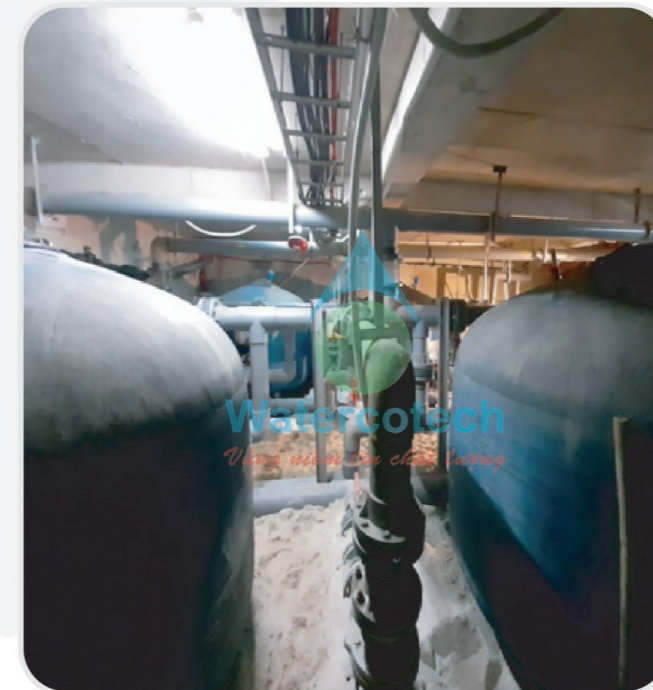
■ Công trình: Thay vật liệu lọc trạm lọc hồ bơi tại JW Mariot