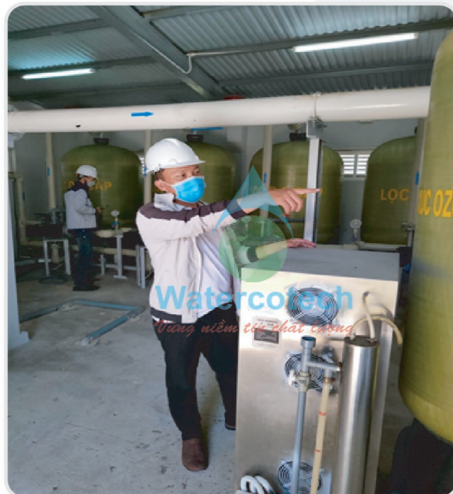
■ Công trình: Cải tạo trạm nước cấp 540m 3 ngày đêm tại Resort Cam Ranh