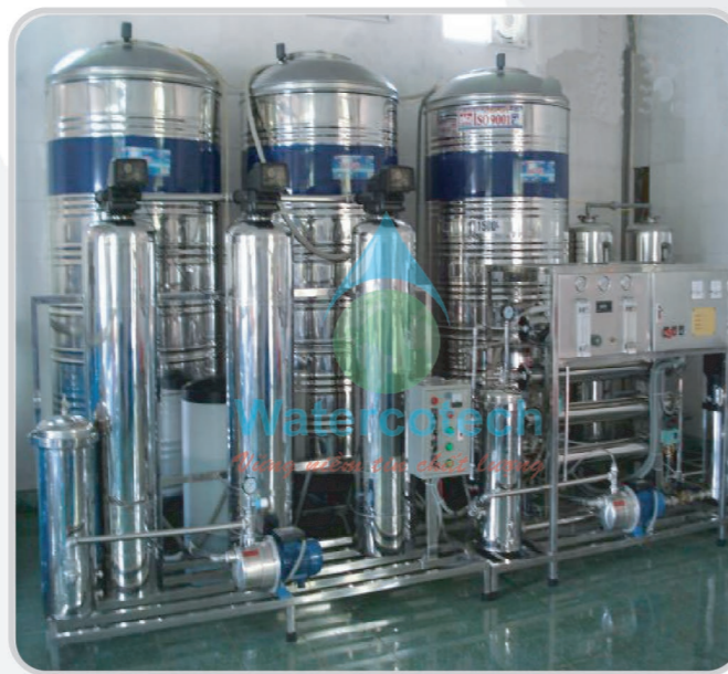
■ Công trình: Tại Quảng Ngãi Hạng Mục: Lắp đặt hệ thống nước đóng bình