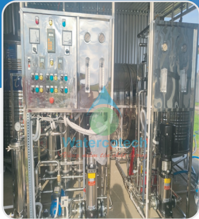
■ Công trình: Cung cấp hệ lọc RO-DI cho Nhà Máy sản xuất vật tư y tế- NIKKISO- KCN Vsip