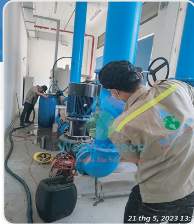
■ Công trình: Tẩy cặn, đánh ống chiller tại Happy Furniture - KCN Vsip