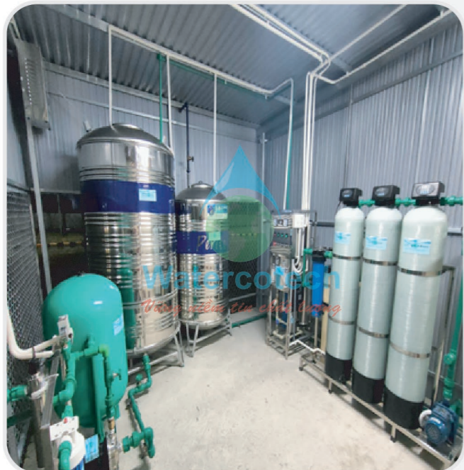
■ Công trình: Lắp đặt hệ lọc nước uống cho công nhân - Nhà Máy Whitex - KCN Vsip