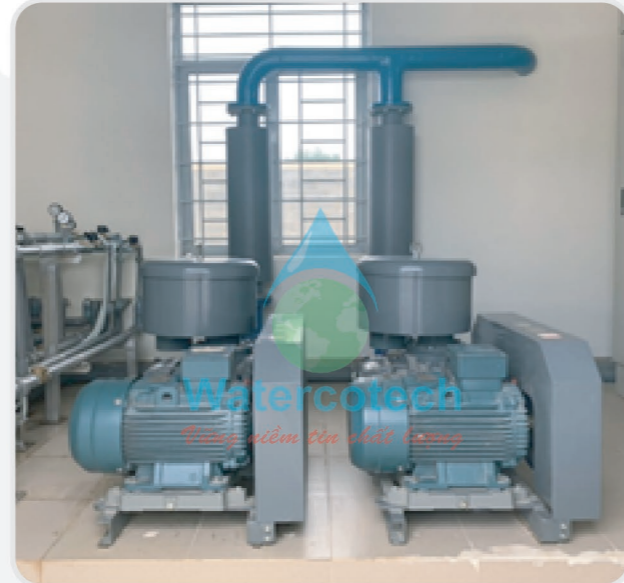
■ Công trình: Tại KCN Quảng Ngãi Hạng Mục: Hệ thống xử lý nước thải sinh hoạt công suất 2000m 3 / ngày đêm