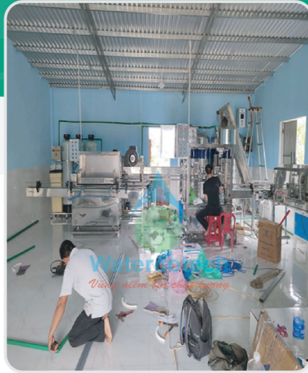
■ Công trình: Hệ thống nước uống đóng chai tự động 1.5m 3 /h tại Thành An