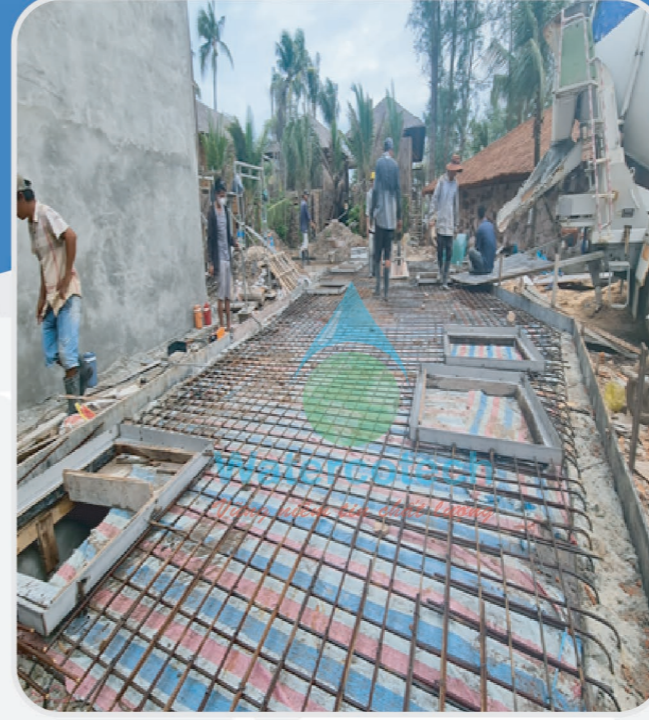
■ Công trình: Lắp đặt hệ thống xử lý nước thải 200 m3 ngày đêm tại Ocean House Phú Quốc