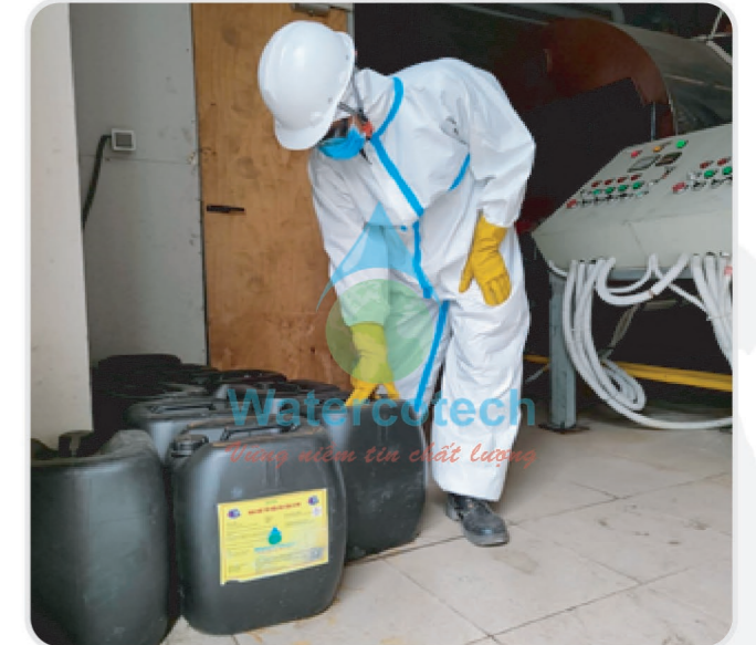
■ Công trình: Tẩy cặn lò hơi Resort Vinpearl Bãi Dài