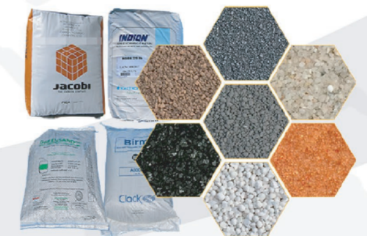
Vật liệu lọc nước