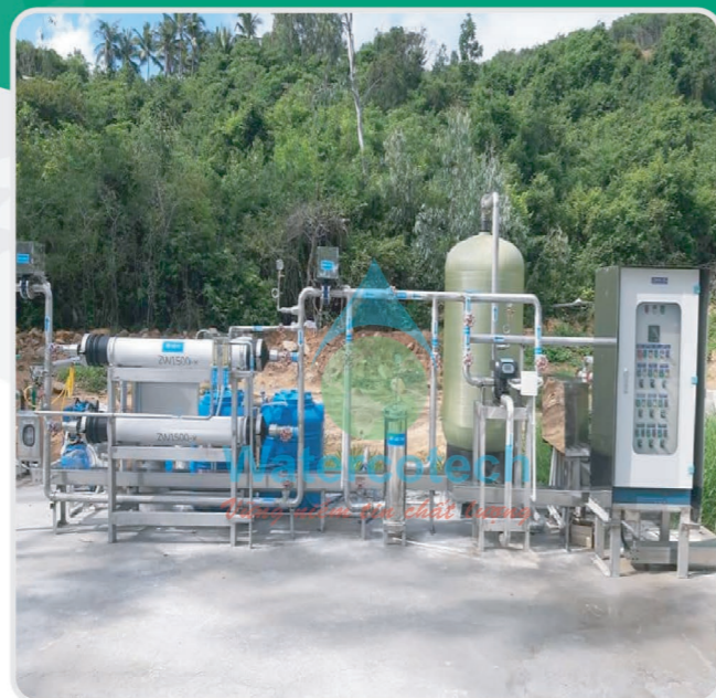
■ Công trình: Tại Vịnh Six Senses Khánh Hòa Hạng mục: Lắp đặt hệ thống lọc UF