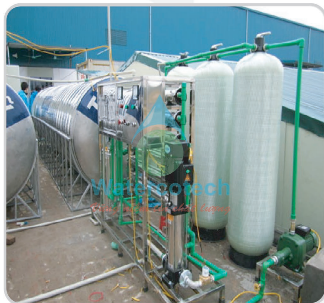
■ Công trình: Tại nhà máy nước Quảng Trị Hạng Mục: Lắp đặt hệ thống Ro 1500 l/h