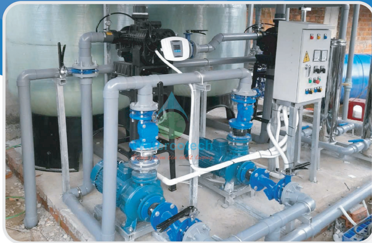
■ Công trình: Lắp đặt hệ lọc 25m 3 /h tại TenTrai KCN Quảng Phú - Quảng Ngãi