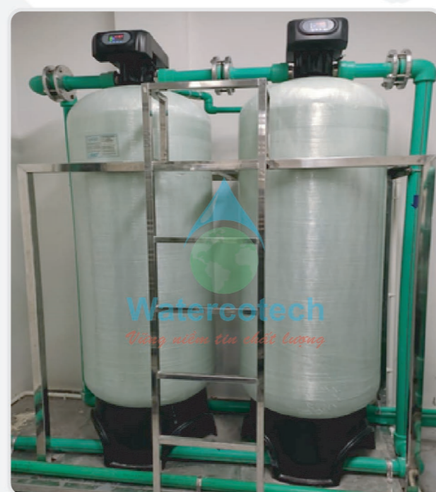
■ Công trình: Lắp mới hệ thống làm mềm 8m 3 /h tại Resort Centara Mirage (Vũng Tàu)