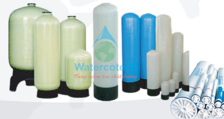
Cột lọc composít - Màng RO công nghiệp