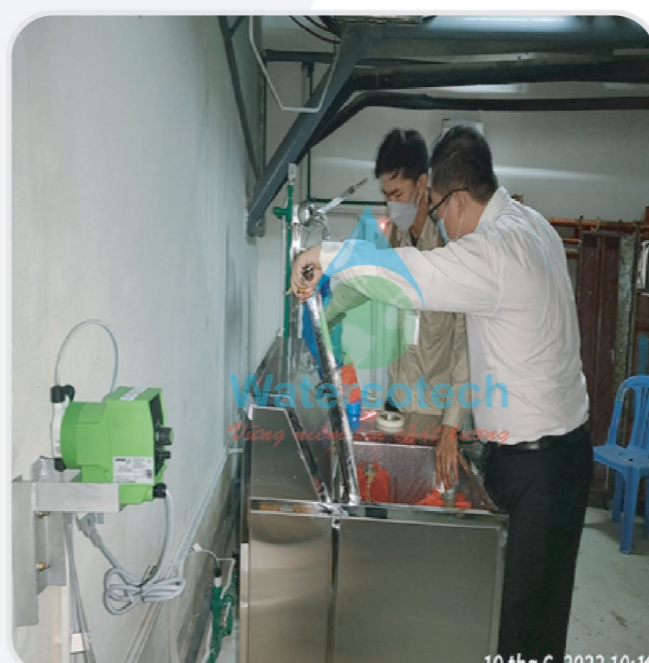
■ Công trình: Lắp đặt hệ thống nước uống đóng Bình cho bệnh viện Quốc Tế Vinmec Nha Trang