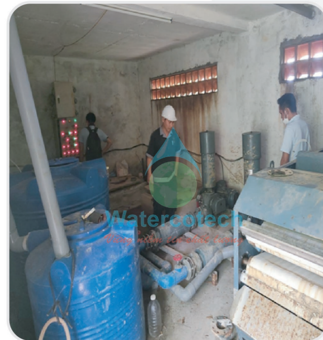
■ Công trình: Cải tạo trạm xử lý nước thải tại Resort Melia