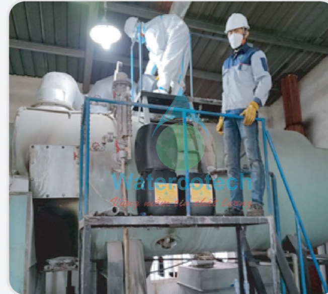
■ Công trình: Tẩy cặn lò hơi nhà máy cám Newhope Bình Định